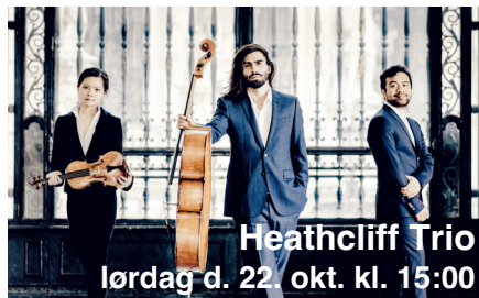
Heathcliff Trio lørdag d. 22. okt. kl. 15:00

Ved koncerten spiller de tre musikere tyske klavertrioer af Haydn, Beethoven og Schumann.