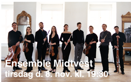
Ensemble Midtvest tirsdag d. 8. nov. kl. 19:30