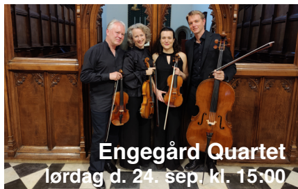
Engegård Quartet lørdag d. 24. sep, kl. 15:00

Ved koncerten i Hobro Musikforening spiller kvartetten musik af Mozart og Debussy, og efter pausen afsluttes med Schuberts strygekvartet nr. 15 i G-dur.