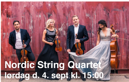
Nordic String Quartet lørdag d. 4. sept. kl. 15:00

Nordic String Quartet blev dannet i 2013 og den har en særlig kærlighed for den nordiske musik, hvilket afspejles i programmet, der har både Pelle Gudmundsen-Holmgreen og Carl Nielsen på programmet.