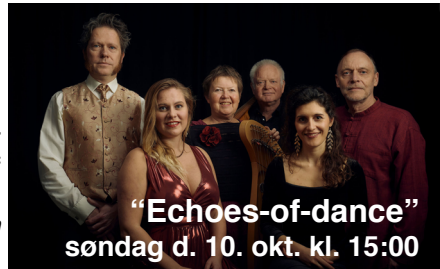
"Echoes-of-dance" søndag d. 10. okt. kl. 15:00

Arrangeret i samarbejde med Teaterkredsen Mariagerfjord.