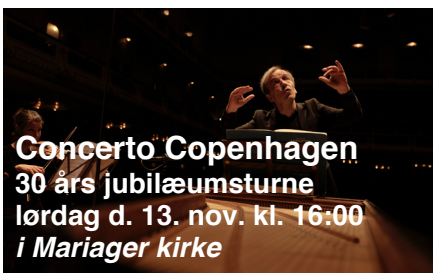
Concerto Copenhagen 30 års jubilæumsturne lørdag d. 13. nov. kl. 16:00 i Mariager kirke

Coco spillede sine første koncerter i 1991, og orkestret fejrer således i 2021 30 år med en række jubilæumskoncerter.