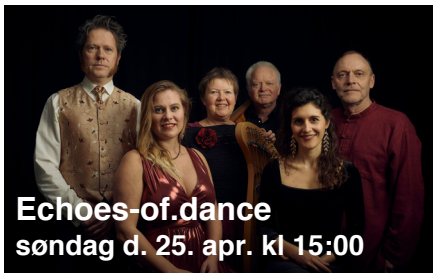
Echoes-of.dance søndag d. 25. apr. kl 15:00

Via Artis Konsorts koncertprogram Echoes-of-dance er en fascinerende musikalsk rejse til 1600-tallets Spanien.