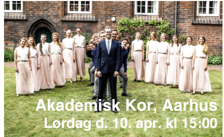
Akademisk Kor, Aarhus Lørdag d. 10. apr. kl 15:00

I 2019 vandt koret intet mindre end VM i kor. Programmet er endnu ikke fastlagt men forårsagtigt bliver det sikkert.