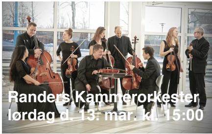
Randers Kammerorkester lørdag d. 13. mar. kl 15:00

Randers Kammerorkester møder op med i alt otte mand/kvinder ved denne koncert, der skal nemlig otte musikere til at spille en oktet.